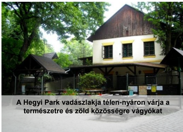
A Hegyi Park vadászlakja télen-nyáron várja a természetre és zöld közösségre vágyókat

Az Erdei Iskolának külön épülete van, ahol sokan szülinapot tartanak. A vadászlak kávézójában nem csak házi jellegű süti, de mesekönyvek és társasjátékok is várnak, télen tűz ropog a kandallóban.. Van hétféle bolhapiac, ahova bárki elhozhatja hasznosnak gondolt tárgyait; csatlakozhatunk biozöldeséges dobozrendszerhez; nyáron élőzene mellett táncolhatunk a fák alatt; hallgathatunk előadásokat és nézhetünk filmeket (egészség, utazás témában); vannak kézműves műhelyek; mama-centrum mamákat érdeklő előadásokkal; és a vállalati kollektíva is jöhet ide önkénteskedni: kiváló csapatépítés pl. a téli tűzifa felaprítása ☺