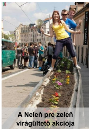
A Nelaň pre zeleň virágültető akciója

Pozsonyban nem nehéz tudatos vásárlónak lenni: szinte minden élelmiszerből és háztartásban használt, környezeti szempontból problematikus termékből kapható öko/bio/újrahasznosított! Egyre több apró biobolt nyílik, ahol a nálunk megszokott termékeken kívül rengeteg cseh áru is található, kiváló minőségben és a hazaihoz hasonló „zöld árakon”. Van több kis és nagy piac helyi (nagy részét határmenti magyar) termelőkkel, fakéregbe csomagolt juhsajt, házitojás/-kacsa/-tyúk, diós bácsi, gyógyteás néni és indiai vegetáriánus menü a belvárosi irodái dolgozóknak a „kevesebb-hús-fenntarthatóbb-élet” jegyében.