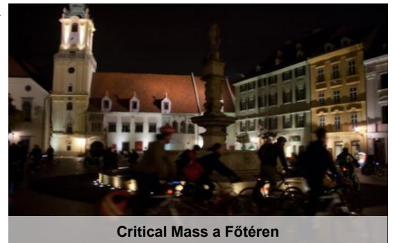
Critical Mass a Főtéren

A szlovák főváros méretét tekintve biztosan „élhetőbb”, mint Budapest – 450.000 lakójával nagyjából negyedakkora. Valahogy több hely jut az embernek az utcán, a buszon, a parkban és a biokávézóban is... ☺ Bár a város délkeleti szélén hatalmas kőolaj-finomító működik, a Pozsonyt átfújó szelek gondoskodnak a levegőminőségről. Autó jóval kevesebb van, a budapesti értelemben vett dugó jóformán nem létezik, legalábbis a pár perces lámpára várakozást nem lehet annak nevezni... Arányaiban mintha több lenne itt a sétálóutca is, szinte a teljes belváros, a vár és a Duna-menti rakpart is a gyalogosoké/bringásoké! A tömegközlekedés (trolli, busz, villamos) kiváló, mindenhova el lehet jutni vele és meglepően olcsó, egy 15 perces jegy 220 Ft, egy egyórás, korlátlan átszállásra jogosító jegy 370 Ft.