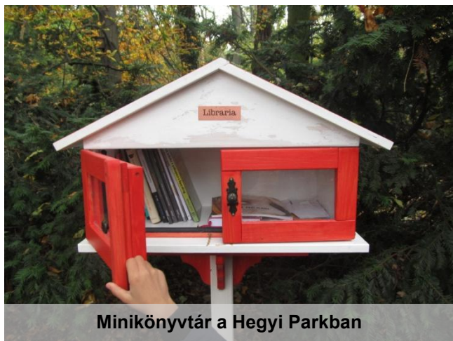
Minikönyvtár a Hegyi Parkban

Egyrészt ide járnak télen-nyáron, közelről és távolról a friss levegőre vágyó anyukák és apukák csemetéikkel. A ház mögötti játszótér a megunt játékok újrahaszosításának kiváló színtere – minden játékot a szülők hoznak a közösbbe, így azok nem kerülnek idő előtt a szemétre és a gyerekek örömmel játszanak bármivel, ami a kezük ügyébe kerül. Állatokat is tart az Alapítvány, így lehet pónit lovagolni, nyuszt etetni, kameruni disznókon csodálkozni – és télen a felocsolt játszódvaron korizni.