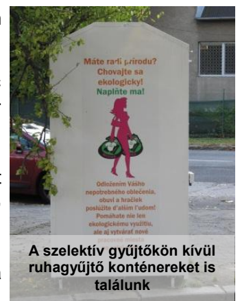
A szelektív gyűjtőkön kívül ruhagyűjtő konténereket is találunk

Jártunkban-keltünkben láttunk lakcímkét (azaz: energetikai tanúsítványt) népszerűsítő plakátot egy felújítás alatt álló házon és a zöldek tevékenységére utaló jelekkel is találkoztunk: leginkább a szlovák Greenpeace anyagaival és a Guerilla Gardening csoport növényültető akcióival, többek között a Parlamenttel szemben. A Neleň pre zeleň (ami szlovákul annyit tesz: ne légy lusta, tégy valamit a környezetedért) egy helyi diákcsoport városi környezetet szépítő akciója.